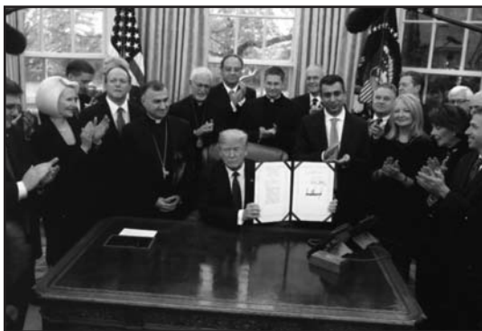
Trump se despide condenando el aborto: "Toda persona está hecha a la santa imagen de Dios".

En Europa también nos encontramos ejemplos como el de Víctor Orban en Hungría, también de confesión luterana, como defensor de los principios cristianos en política y referente europeo y mundial