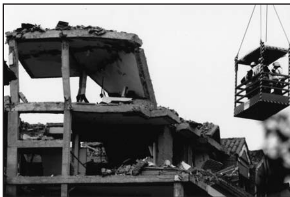
(En la foto, Expertos supervisan la estructura del edificio siniestrado en la calle Toledo tras la explosión de gas.)

Un equipo de bomberos del Ayuntamiento de Madrid pudo rescatarlo a través