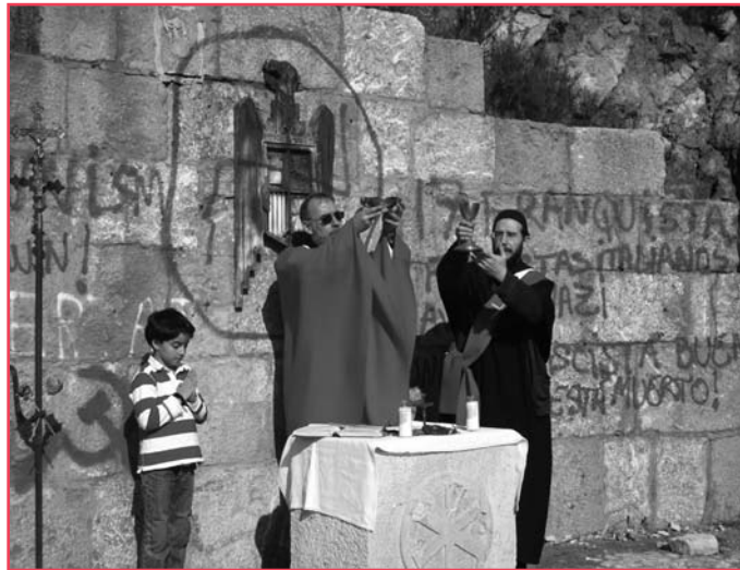
Celebración de la Santa Misa en el lugar del sacrificio