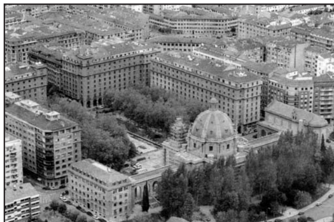
Vista aérea del Monumento de los Caídos, ubicado en primer término, presidiendo el II Ensanche

E L MONUMENTO A LOS MÁRTIRES DE LA CRUZADA de Pamplona, también conocido como Monumento a los Caídos o simplemente “los caídos”, ha pasado de ser un glorioso y espectacular edificio-monumento-templo de culto, a ser una china en el zapato de todos los grupos políticos con representación parlamentaria y municipal. Levantado por la entonces Diputación Foral de Navarra y el Ayuntamiento de Pamplona,