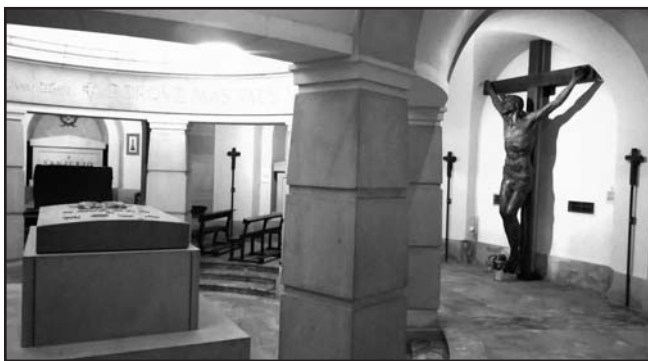
Cripta del Monumento con el Crucifijo de Adsuara y los sepulcros de Mola y Sanjurjo y compañeros cruzados

La cámara situada junto a la rejilla de acero estaba en la zona controlada por el Ayuntamiento. Se acudió a la Policía Nacional. Al día siguiente llegó la Brigada Provincial de Información. Dos policías desmontaron el dispositivo que subía por las escaleras de caracol hasta la base de la sala de exposiciones del monumento donde se conectaba el cable. Levantaron acta. La Hermandad ha denunciado los hechos. Se trata de un presunto delito de revelación de secreto , gravísimo al realizarse desde un edificio municipal cerrado al público. ¡Ay si fuesen otros los espías!