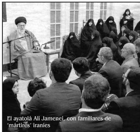
El ayatolá Ali Jamenei, con familiares de 'mártires' iraníes

Estados Unidos de América. SE HAN UNIDO A LA PROFESIÓN DE LA VERDAD SOBRE EL MATRIMONIO SACRAMENTAL DE TRES OBISPOS DE